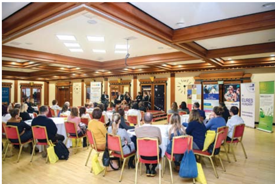
Pillanatkép a 2017. november 28-i , társhálózatokkal közösen szervezett Navigátor szakmai műhelynapról

A „ Mobilitás az Európai Unióban ” társhálózati együttműködésünk keretében 2012 óta az uniós információs hálózatokkal (EURES, Euroguidance, Europass, Eurodesk) közösen és összehangoltan tervezük munkaprogramjainkat, valamint beszámolunk egymásnak az elért eredményekről, aktualitásokról. Együtt működtetjük a fiatalok mobilitását segítő választóoldalunkat ( www.mobilitasazeuban.hu ), emellett közösen jelenünk meg fiataloknak szóló országos és vidéki rendezvényeken és állásbörzéken.