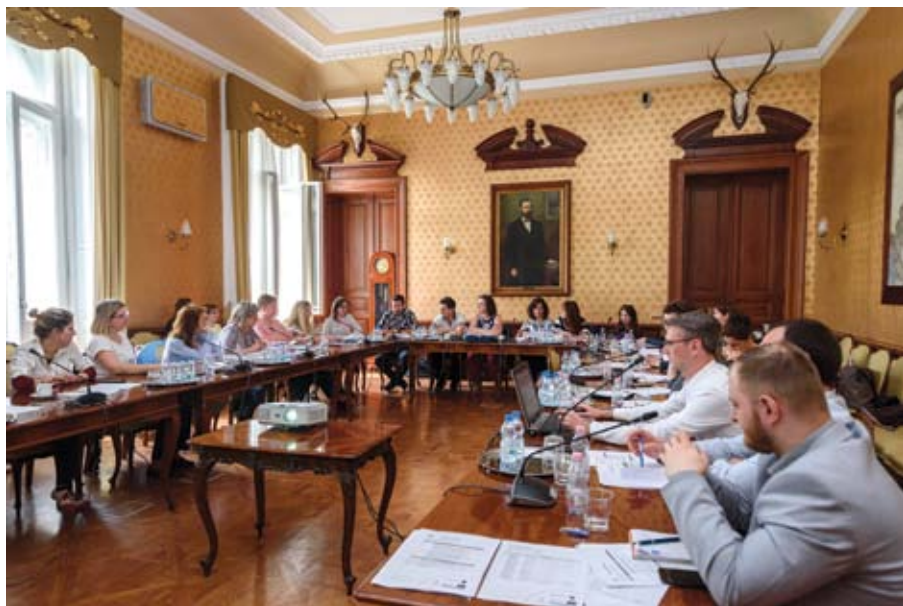
Pillanatkép a 2018. április 24-i EURES-tanácsadói értekezletről

Állandó jelleggel kerültek megrendezésre EURES-tanácsadói értekezletek , amelyeknek célja a hálózat működésének koordinációja, valamint az európai szintér újdonságainak bemutatása. Az ilyen értekezletek programját a szakmát érintő kihívásokra reflektáló előadások alkotják.