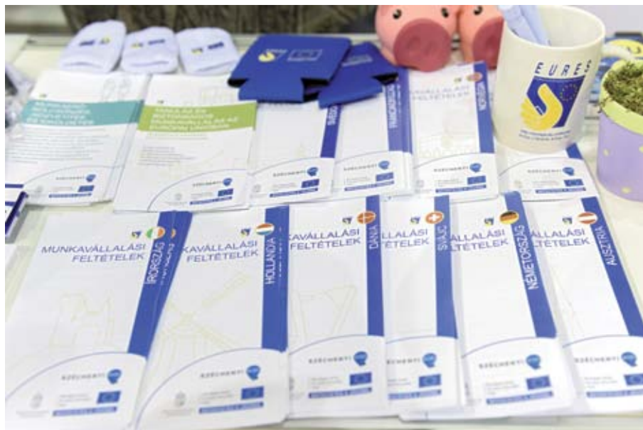
EURES-kiadványok és promóciós termékek a 2018-as HVG állásbörzén

A hálózati találkozók alkalmat nyújtottak a mély szakmai munkára és lehetőséget biztosítottak a tanácsadóinknak az adott év során felmerült kérdések szakszerű megvitatására. Lehetőséget adunk kollégáinknak a külföldi jó gyakorlatok megismerésére, más tagállami foglalkoztatási és EURES-kötődésű rendszerek tanulmányozására is. Az elmúlt években kollégáink szakmai tanulmányutak keretében megismerhették az ausztriai, németországi jó gyakorlatokat.